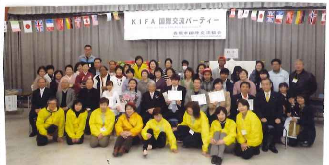
(終了後は、参加者全員で記念撮影)