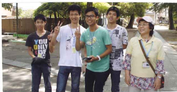
高校生男子はとても陽気です

さらに、講演の後、逐語通訳ロールプレイング演習では、外国人から生活上の相談を受ける場面の実習を行ないました。(吉川玲子・記)