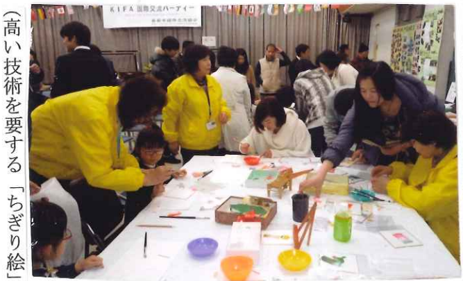
高い技術を要する「ちぎり絵」