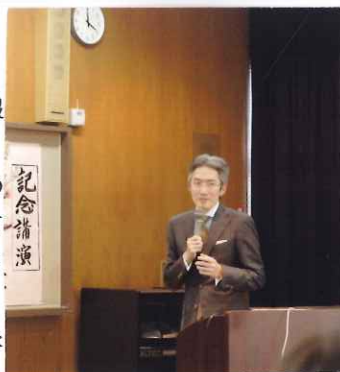
(講演する小森成先生)

第2部は、日本歯科大学附属病院・矯正歯科教授の小森成氏による「日本人の見た異文化～日本と外国との違い」と題する講演があ