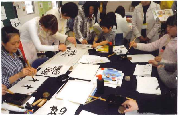
いつも大人気、盛況の「書道」

今年度からは成田での大会がなくなったのは大変残念ですが、これからも、毎週末の日本語教室で研修に磨きをかけていただけたらと期待しています。