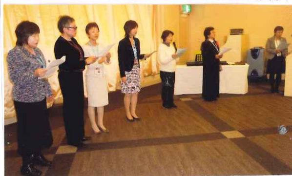
楽しく歌う通訳部会メンバー